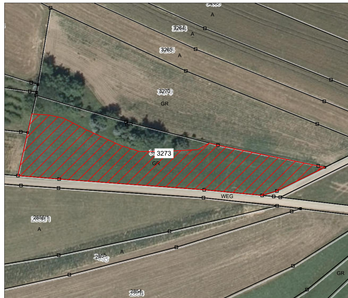
externe Ausgleichsfläche Flst. Nr. 3273, Gemarkung Adelhausen M 1:1.000