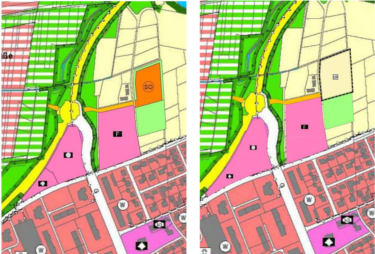
Links: Ausschnitt aus dem Flächennutzungsplan (Bestand), unmaßstäblich Rechts: Ausschnitt aus der Flächennutzungsplan-Teiländerung, unmaßstäblich