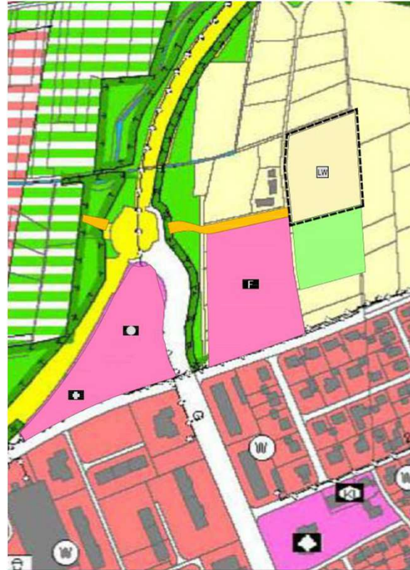
Ausschnitt aus der Flächennutzungsplan-Teiländerung, unmaßstäblich