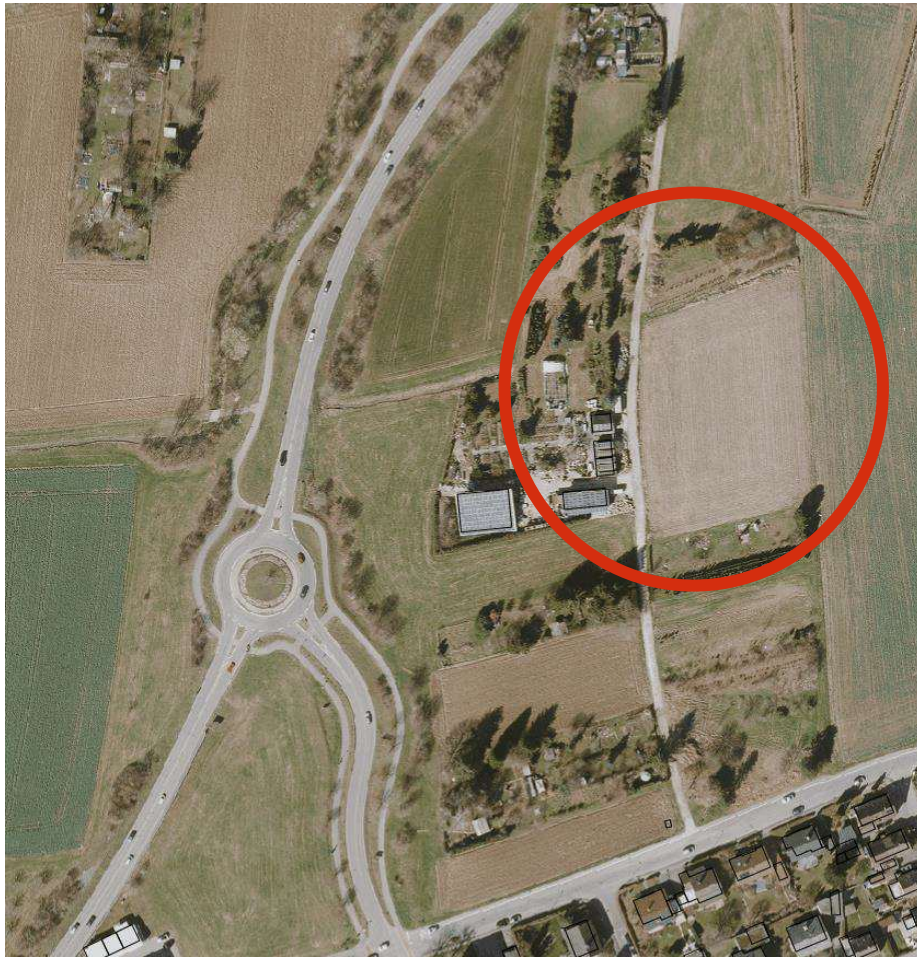
Luftbild mit Planungsbereich