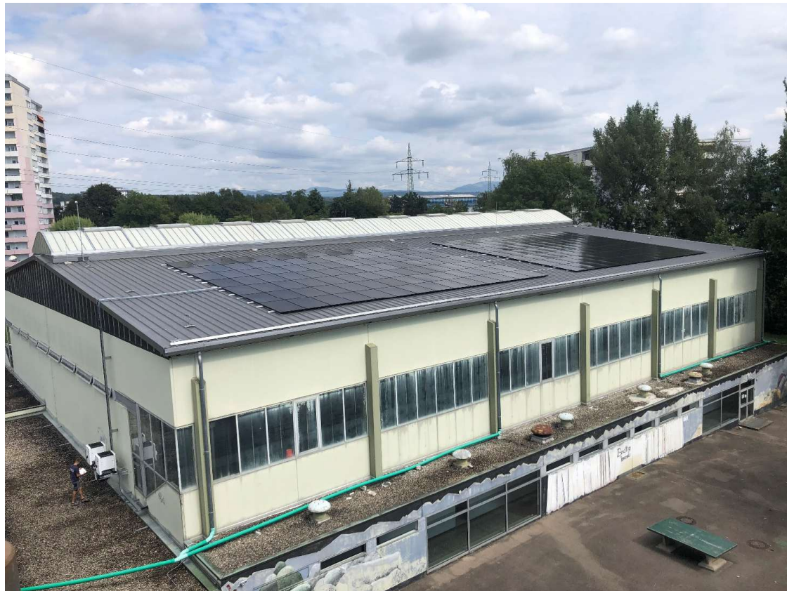
Blick vom Gymnasium