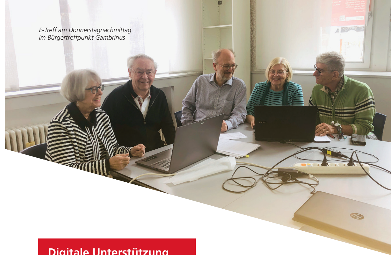
E-Treff am Donnerstagnachmittag im Bürgertreffpunkt Gambrinus

In Rheinfelden (Baden) bietet der E-Treff seit über fünfzehn Jahren jeden Donnerstagnachmittag individuelle Hilfestellung rund um moderne Kommunikationsmittel wie Smartphone, Tablet und Laptop an. Engagierte unterstützen Seniorinnen und Senioren direkt an ihren eigenen mobilen Endgeräten. Auch hier gehört der persönliche Austausch bei Kaffee und Kuchen dazu.