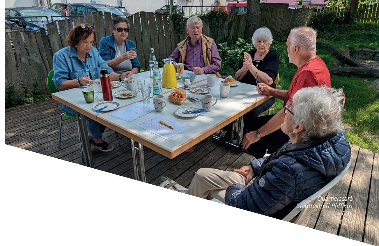
Quartierscafé Stadtteiltreff Pfiffikus 60+

„Das ist eine sehr gute Idee, dass Senioren angeschrieben und informiert werden.“ (Seniorin)