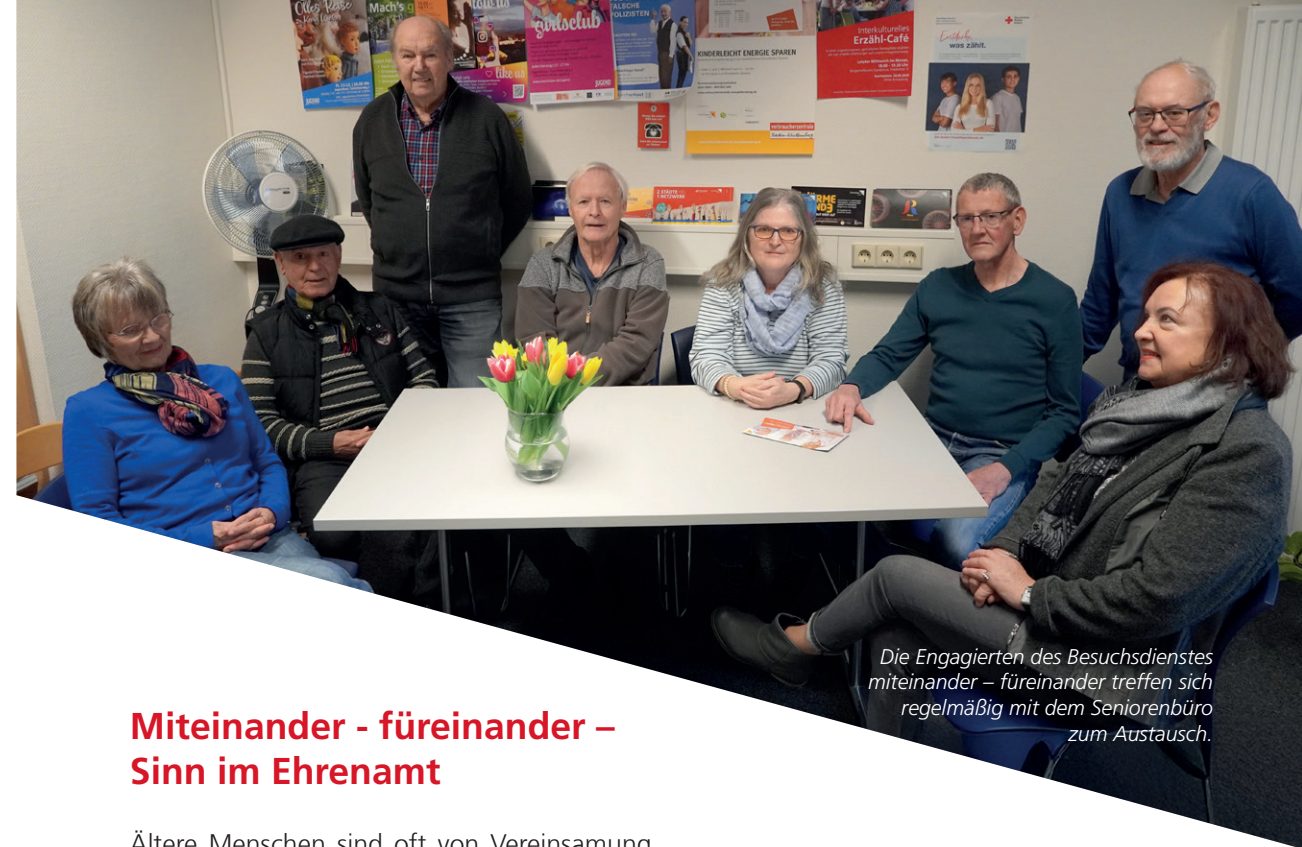
Die Engagierten des Besuchsdienstes miteinander – füreinander treffen sich regelmäßig mit dem Seniorenbüro zum Austausch.

„Mein Mann verstarb letztes Jahr. Die seelisch-moralische Unterstützung im Quartierscafé war mir sehr wichtig und tröstlich.“