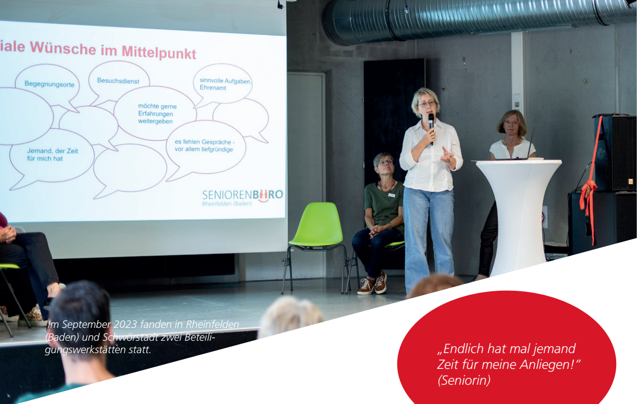
Im September 2023 fanden in Rheinfelden (Baden) und Schwörstadt zwei Beteiligungswerkstätten statt.

„Endlich hat mal jemand Zeit für meine Anliegen!“ (Seniorin)