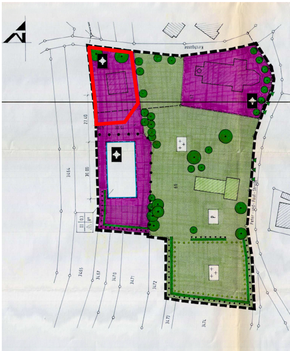
Bebauungsplan „Kirche-Friedhof“, ohne Maßstab

Der Planbereich befindet sich im westlichen Teil des Ortsteils Minseln. Im Osten befinden sich die katholische Kirche „St. Peter und Paul“ und der Friedhof. Südlich des Grundstücks liegt das dazugehörige Gemeindezentrum, und nördlich des Grundstücks wird es von der Kirchgasse begrenzt. Der Planbereich liegt im Geltungsbereich des Bebauungsplanes „Kirche-Friedhof Minseln“ vom 24.10.1996, in welchem es als Fläche für Gemeindebedarf festgesetzt ist. Da eine Wohnbebauung auf diesen Flächen nicht zulässig ist, ist eine Änderung des Bebauungsplans erforderlich. Im Rahmen dieser Änderung soll ein ca. 660 m 2 großer Bereich im Nordwesten des Bebauungsplans „Kirche-Friedhof Minseln“, in dem das Pfarrhaus liegt, in ein Dorfgebiet (MD) gemäß § 5 BauNVO umgewandelt werden. Der Bebauungsplan „Kirche-Friedhof Minseln“ vom 24.10.1996 stellt sich für den Änderungsbereich wie folgt dar: